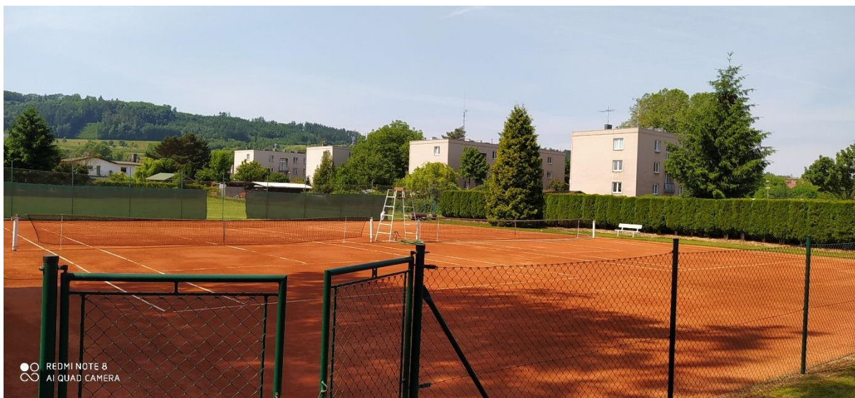
Obrázek 3: Tenisové kurty v areálu TJ Velešov

Součástí Sportovního areálu TJ Velešov jsou i tenisové kurty, jejichž plocha je cca 2 220 m 2 :