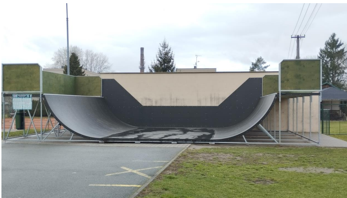
Obrázek 7: skateparková minirampa

Tato skateparková minirampa umístěna na doudlebském všesportovním areálu byla uvedena do provozu 16.10.2023 a rozloha minirampy činí 12 x 7 m.