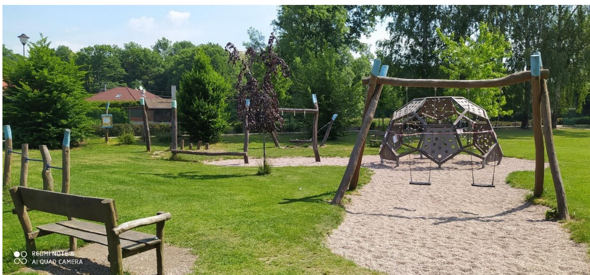
Obrázek 9: Dětské hřiště „Kopačák“

Vybavení: prolézačka - fotbalový balon, houpačky, 2x lavičky, houpací hnízdo, pochozí špalky, malé dětské hrazdy, přecházezí kulatina s lanem a úchyty.