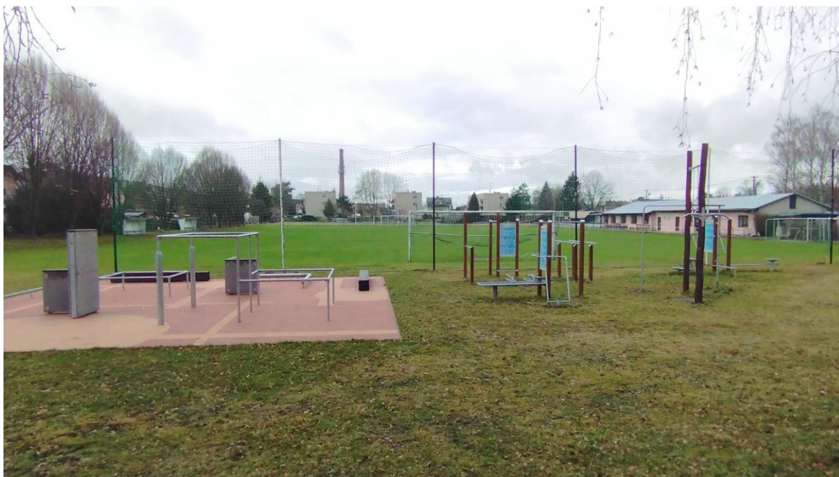
Obrázek 6: Ukázka posilovacích strojů

Toto workoutové a parkourové hřiště bylo uvedena do provozu v březnu 2022 .