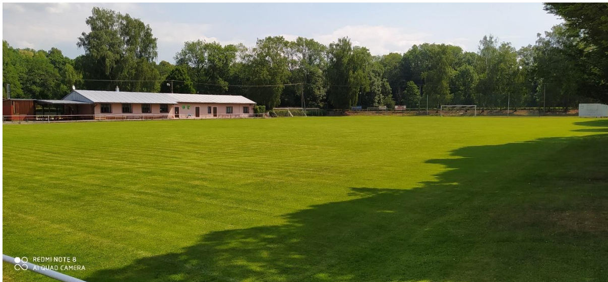
Obrázek 2.: Fotbalové hřiště se zázemím

Nachází se prakticky v centrální oblasti městyse Doudleby nad Orlicí na celkové ploše 17 724 m 2 .