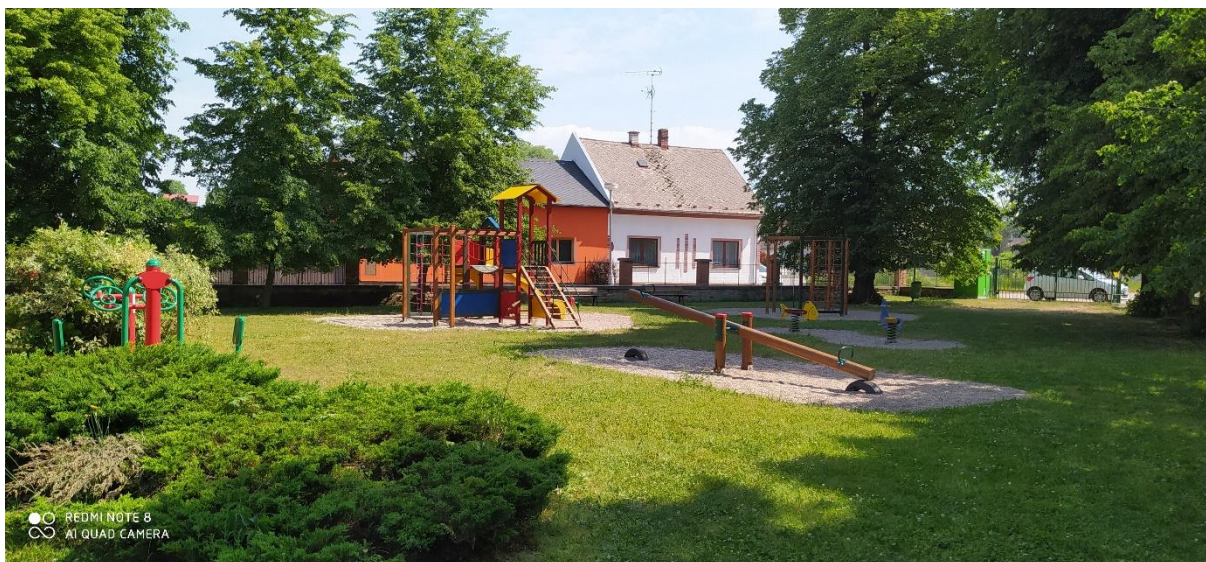
Obrázek 8: Dětské hřiště Na Třešňovce