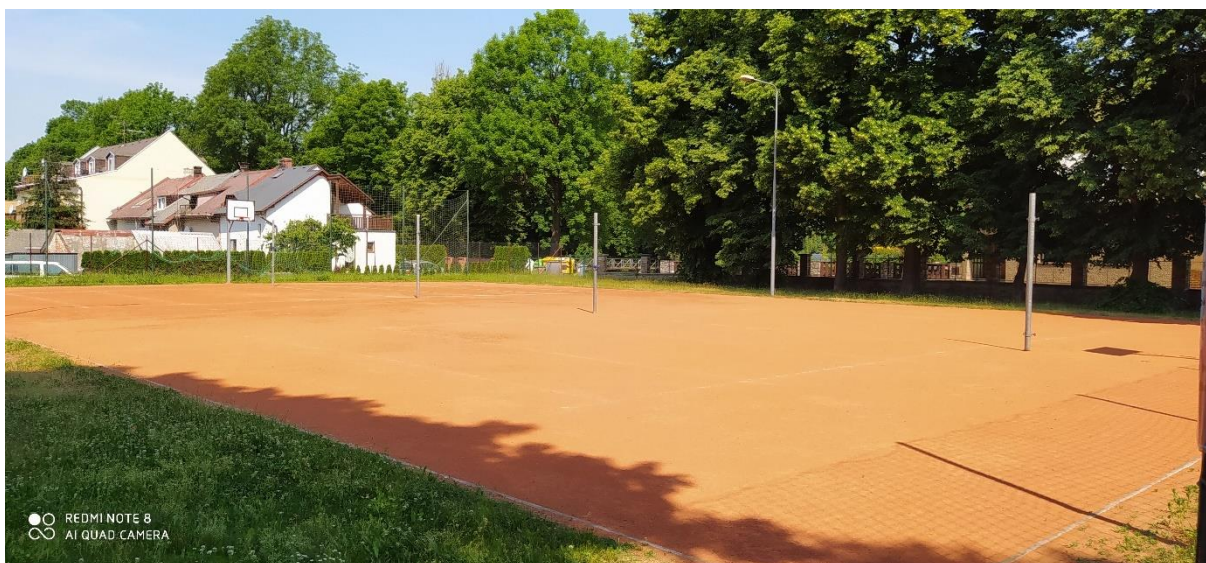
Obrázek 4: Multifunkční hřiště Na Třešňovce

Také tento sportovní areál se nachází v centru městyse na celkové ploše 3 107 m 2 .