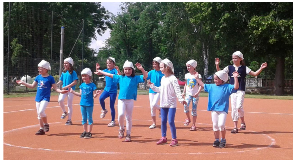
Dětský den pořádaný TJ Sokol na Třešňovce