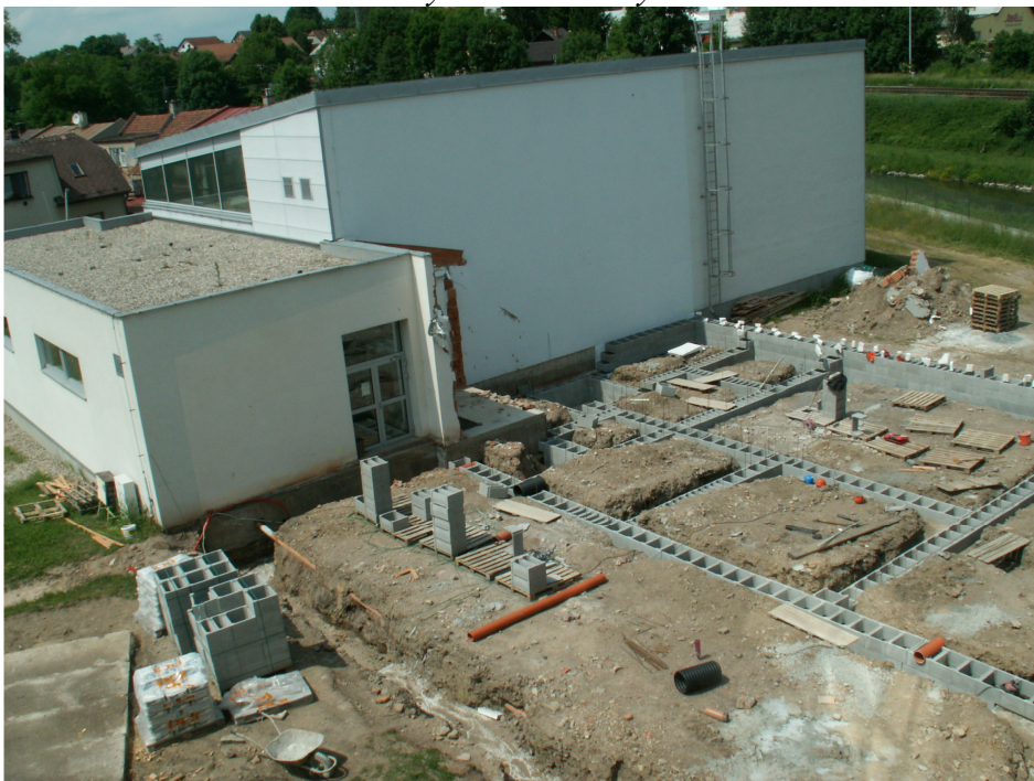
Dostavba budovy základní školy ZAHÁJENA!